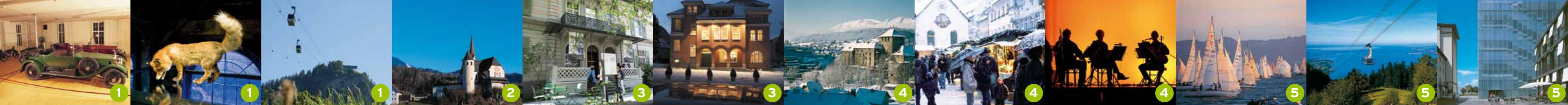
Dornbirn Rolls-Royce Museum - die weltweit größte Sammlung. Dornbirn inatura - wegweisendes Naturmuseum.