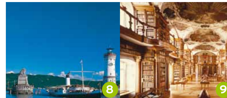
Lindau Verträumte Bodenseeestadt am bayerischen Ufer.